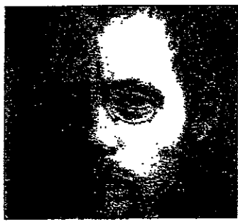
Charles Péguy est mort à 41 ans, le 5 septembre 1914, criblé d'une balle en pleine tête.